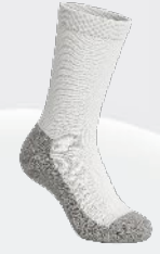
7203 Bas d'exercice au mollet 4 95 $ 3 et ++ : 4 50 $ / unité