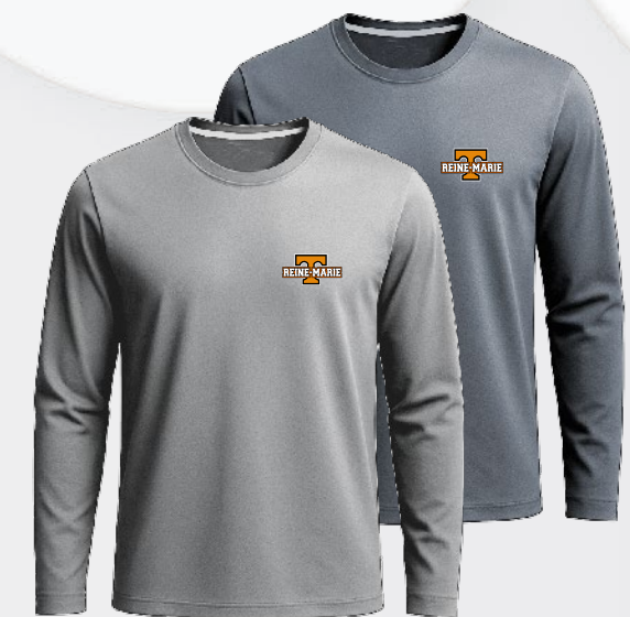
3332 T-shirt en polyester 27 75 $