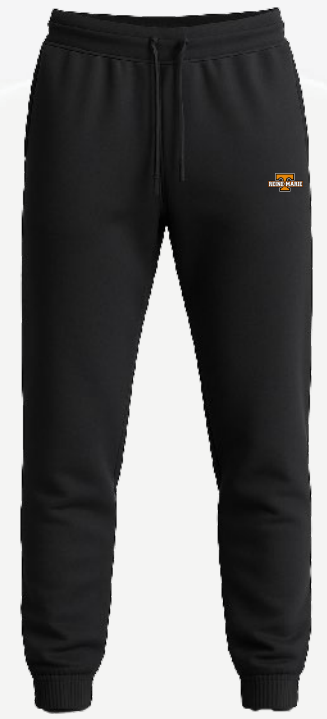
2306 Pantalon molleton léger, chevilles élastiquées 36 00 $