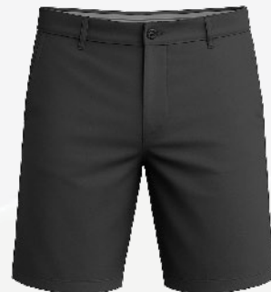
6102 Bermuda de golf en toile 44 50 $