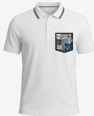
3154 Polo en coton piqué 35 00 $