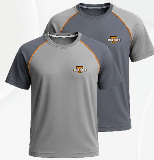
3308 T-shirt en polyester 26 75 $