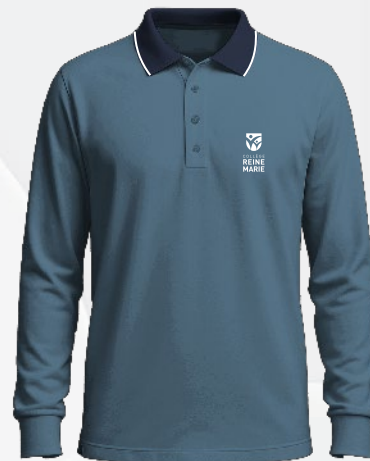
3117 Polo en coton piqué 35 50 $