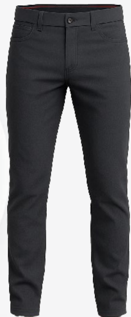
2106 Pantalon ajusté en toile 56 00 $ En 1 re secondaire, un pantalon est obligatoire (coupe droite ou cintrée, au choix)