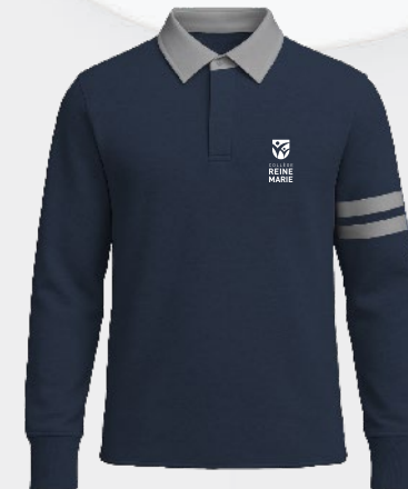
7703 Rugby col contrastant en molleton léger 40 00 $