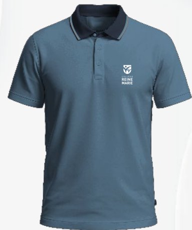
3106 Polo en coton piqué 34 00 $