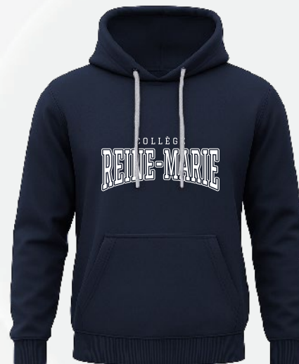
3401 Kangourou ouaté 47 00 $