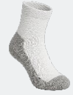
7201 Bas d'exercice 3 95 $ 3 et ++ : 3 00 $ / unité